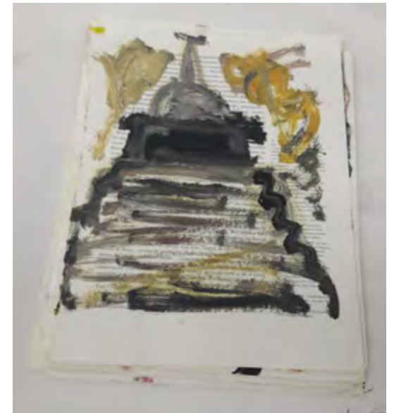
Wisdom and Compassion , livre effacé Joseph Beuys exposé au musée Gassendi, dans le cadre de l'exposition Sacrées Montagnes Sacrées , 28 mars - 30 octobre 2018 – erased Joseph Beuys book exhibited at Musée Gassendi in the exhibition Sacrées Montagnes Sacrées , 28 March-30 October 2018.

Cette gestuelle évoque une multiplicité de rythmes, de la lenteur cérémoniale des prosternations, évoquées par des toiles à même le sol – larges bandes blanches ou noires qui se chevauchent – à la frénésie des tournolements spiraliqes (la danse vive des stupa, évoquée dans les thang-ka, suspendus, palpitants au moindre souffle). Cette atmosphère singulière, cette ambiance, est fortement accentuée par des inscriptions brèves, péremptoires, comme des éclairs verbaux, des sortes de Koan très particuliers, issus d'une culture occidentale rock-punk-psychédélique, opérant ainsi une symbiose Orient-Occident, l'expérience transversale d'un artiste qui a franchi les frontières et propose de nouvelles voies. Georges Autard révèle, comme dans un instant foudroyant, un cheminement singulier, loin du spectacle de l'art contemporain, au-delà des tendances qui s'affrontent pour obtenir le podium mondial (avec prix, décorations et reconnaissance), hors du brouhaha médiatique si dérisoire, englué dans son tapage publicitaire. Par ses toiles, par ses tableaux, par ses dessins, par ses inscriptions, il manifeste un parcours spirituel exemplaire, vers un autre monde, loin des bruits et du vacarme illusoire d'une société planétaire (et touristique) aveuglée dans sa course technologique. C'est le Mystik Esthetik Kommando .