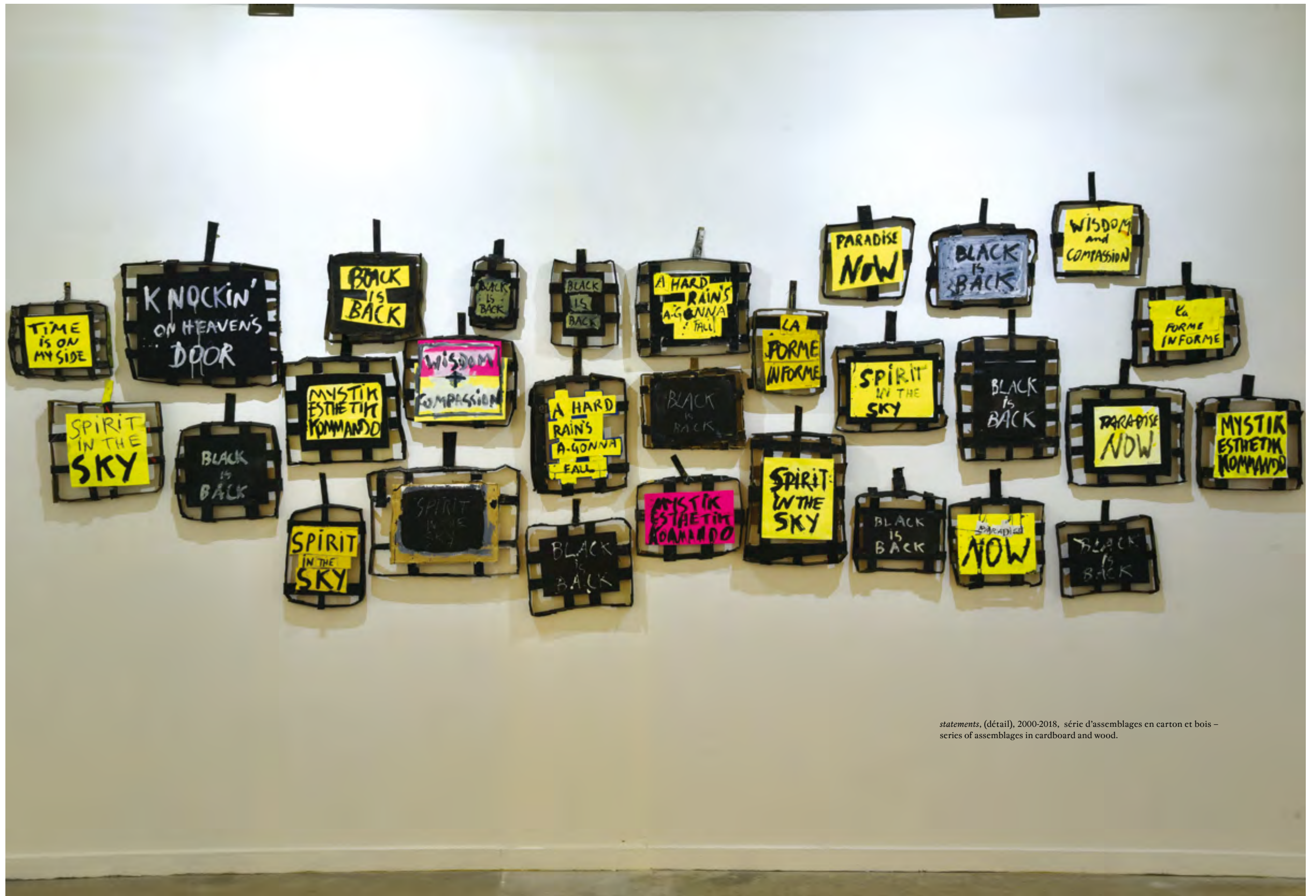
statements, (détail), 2000-2018, série d'assemblages en carton et bois – series of assemblages in cardboard and wood.