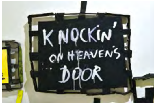
statements (détail – détail), 2000-2018, série d'assemblages en carton et bois – series of assemblages in cardboard and wood.

une mise au noir, vers le vide, là où toute explicitation est abolie ? Des recouvrements, des noircissements, des nappes noires black is back pour obscurcir (abolir ?) tout message, pour rendre illisible toute forme ( fucking Mondrian ) et nous plonger dans l'énigme de l'inconnaitance des mystiques, dans un brouillage des signes vers l'illisible du plein vide, ce que confirme les suites endiablées de tourbillons ( perpetuum mobile ), car, sous les apparences, il n'y a que mouvements de mouvements d'entrecroisements de coïncidences.