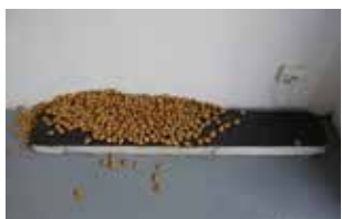
Hervé Bréhier, sans titre (enduit posé poussé) , 2016, bois, enduit de lissage, graphite, amandes, 120 x 21 x 12 cm.