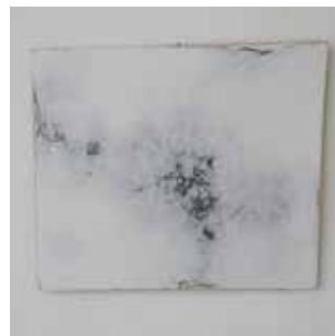
Hervé Bréhier, sans titre (enduit tracé enduit poncé) , 2016, contreplaqué, enduit de lissage, mine de plomb, 36 x 43 cm.