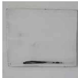
Hervé Bréhier, sans titre (enduit tracé enduit poncé) , 2016, contreplaqué, enduit de lissage, mine de plomb, 29 x 35 cm.