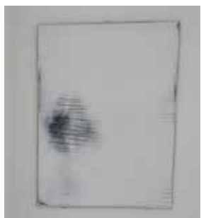
Hervé Bréhier, sans titre (enduit tracé enduit poncé) , 2016, contreplaqué, enduit de lissage, mine de plomb, 49 x 36 cm.