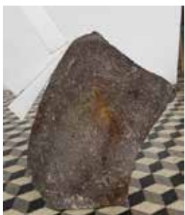
Hervé Bréhier, sans titre (enduit posé calé) , 2016, pierre de taille, bois, enduit de lissage, dimensions variables.