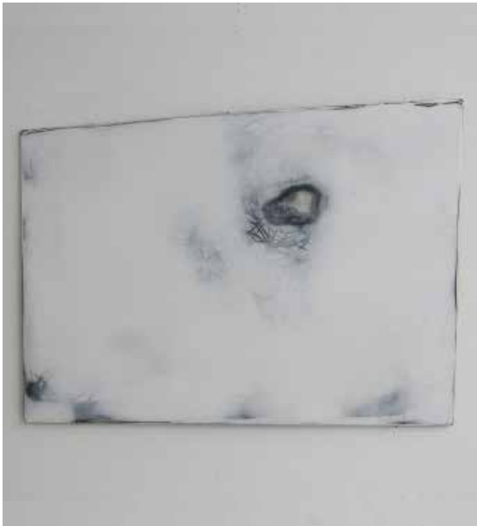
Hervé Bréhier, sans titre (enduit tracé enduit poncé) , 2016, contreplaqué, enduit de lissage, mine de plomb, 29 x 35 cm.