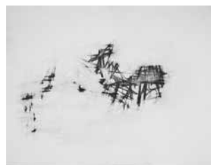
Hervé Bréhier, sans titre (enduit tracé enduit poncé) , 2016, contreplaqué, enduit de lissage, mine de plomb, 35 x 48 cm.