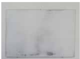
Hervé Bréhier, sans titre (enduit tracé enduit poncé) , 2016, contreplaqué, enduit de lissage, mine de plomb, 26 x 37 cm.