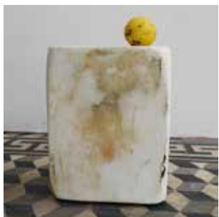
Hervé Bréhier, sans titre (graissé enduit poncé posé) , 2016, bois, graisse, enduit de lissage, citron, 31 x 20 x 23 cm ; 26 x 30 x 20 cm.