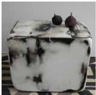
Hervé Bréhier, sans titre (graissé enduit poncé posé) , 2016, bois, huile de vidange, enduit de lissage, figue, 24 x 31 x 20 cm ; 31 x 23 x 20 cm.