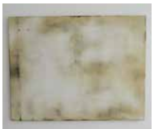
Hervé Bréhier, sans titre (graissé enduit poncé) , 2016, bois, graisse, enduit de lissage, 96 x 125 cm.