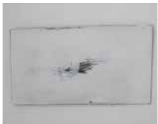
Hervé Bréhier, sans titre (enduit tracé enduit poncé) , 2016, contreplaqué, enduit de lissage, mine de plomb, 25 x 45 cm.