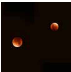
Double moon, éclipse de lune, Bruxelles, 2015/17, tirage couleur jet d'encre, 3 ex. + 2 épreuves d'artistes, 60 x 80 cm.