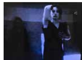
Isabelle, Kerguéhennec, performance, danse de Pier Paolo Calzolari, 1996, tirage argentique unique sur papier Agfa, 147 x 100 cm.