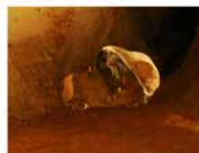
Vanité préhistorique, Grotte du Perch Merle, 2014, tirage couleur jet d'encre, 3 ex. + 2 épreuves d'artistes, 72 x 57 cm.