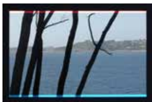
La Rencontre d'English Rose et de Marin Blue, installation à la galerie du Douven, Locquémeau, 2014/17, tirage couleur jet d'encre, plaque de verre, 3 ex. + 2 épreuves d'artistes, 94,5 x 65 cm.