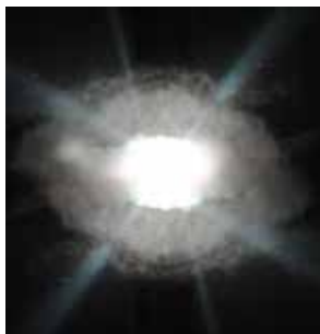
Cosmic, phare de Goulphar, Kervilahouen, 2014/17, tirage couleur jet d'encre, 3 ex. + 2 épreuves d'artistes, 99 x 104 cm.

Pages suivantes : Vues de l'exposition Shadowplay , galerie quatre, Arles, 2017. Crédits photo Isabelle Arthuis.