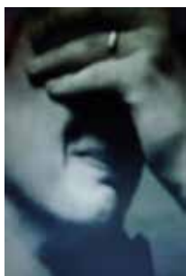
Control, poster, 2017, 65 x 43 cm.