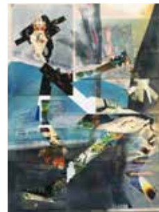
Robert Suermondt, Pantin , 2016, huile, collage sur papier, 36 x 27 cm, prix de vente : 700 euros