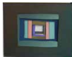
Robert Suermondt, module, 2015, acrylique sur toile, 39 x 30 cm, prix de vente : 2500 euros