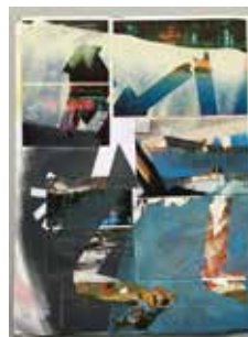
Robert Suermondt, Pantin , 2016, huile, collage sur papier, 36 x 27 cm, prix de vente : 700 euros