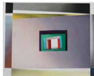
Robert Suermondt, module, 2015, acrylique sur toile, 46 x 55 cm, prix de vente : 3800 euros