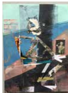
Robert Suermondt, Pantin , 2016, huile, collage sur papier, 36 x 27 cm, prix de vente : 700 euros