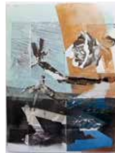
Robert Suermondt, Pantin , 2016, huile, collage sur papier, 36 x 27 cm, prix de vente : 700 euros