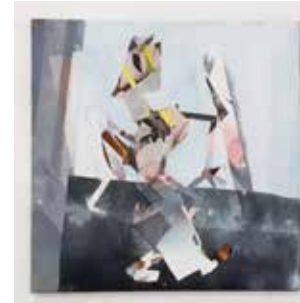
Robert Suermondt, Daisy , 2015, huile et collage sur toile, 40 x 40 cm, prix de vente : 3200 euros