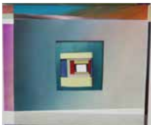
Robert Suermondt, module, 2015, acrylique sur toile, 46 x 55 cm, prix de vente : 3800 euros