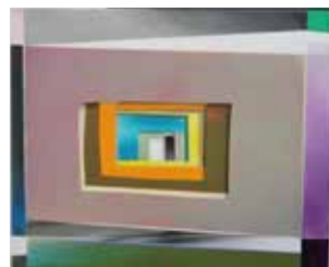
Robert Suermondt, module, 2015, acrylique sur toile, 46 x 55 cm, prix de vente : 3800 euros