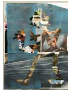
Robert Suermondt, Pantin , 2016, huile, collage sur papier, 36 x 27 cm, prix de vente : 700 euros