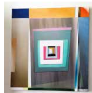
Robert Suermondt, Miroir (écart) , 2015, acrylique sur toile, 80 x 75 cm, prix de vente : 5600 euros