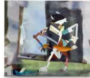
Robert Suermondt, Guitariste , 2015, huile sur toile, 38 x 44 cm, prix de vente : 3200 euros