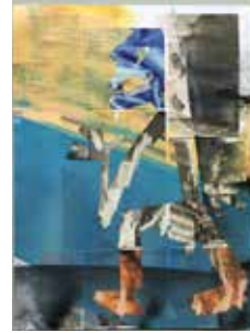
Robert Suermondt, Pantin , 2016, huile, collage sur papier, 36 x 27 cm, prix de vente : 700 euros