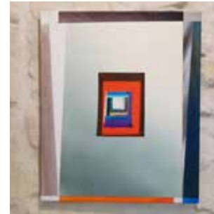
Robert Suermondt, module, 2015, acrylique sur toile, 55 x 46 cm, prix de vente : 3800 euros