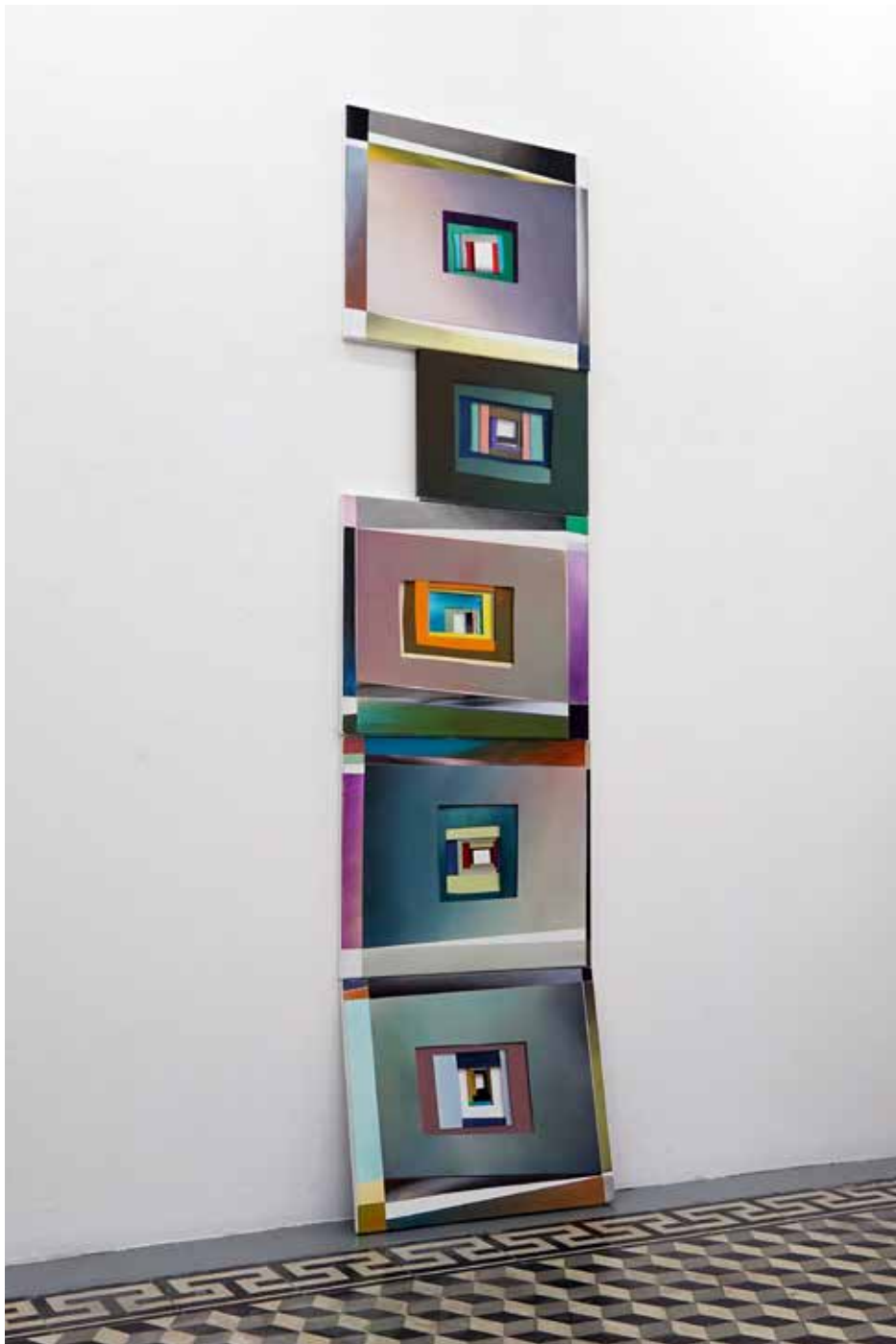
Robert Suermondt, colonne, 2015, 5 modules, acrylique sur toile, 223 x 55 cm prix de vente : 12500 euros