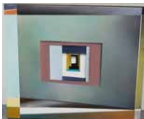
Robert Suermondt, module, 2015, acrylique sur toile, 46 x 55 cm, prix de vente : 3800 euros