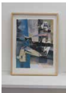
Robert Suermondt, Pantin , 2016, huile, collage sur papier, encadré, 36 x 27 cm, prix de vente : 850 euros