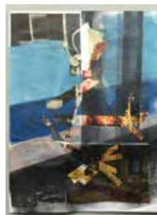
Robert Suermondt, Pantin , 2016, huile, collage sur papier, 36 x 27 cm, prix de vente : 700 euros