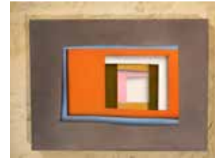
Robert Suermondt, Miroir (rouge) , 2015, acrylique sur toile, 35 x 26 cm, prix de vente : 2300 euros