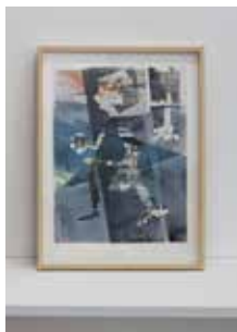
Robert Suermondt, Pantin , 2016, huile, collage sur papier, encadré, 36 x 27 cm, prix de vente : 850 euros